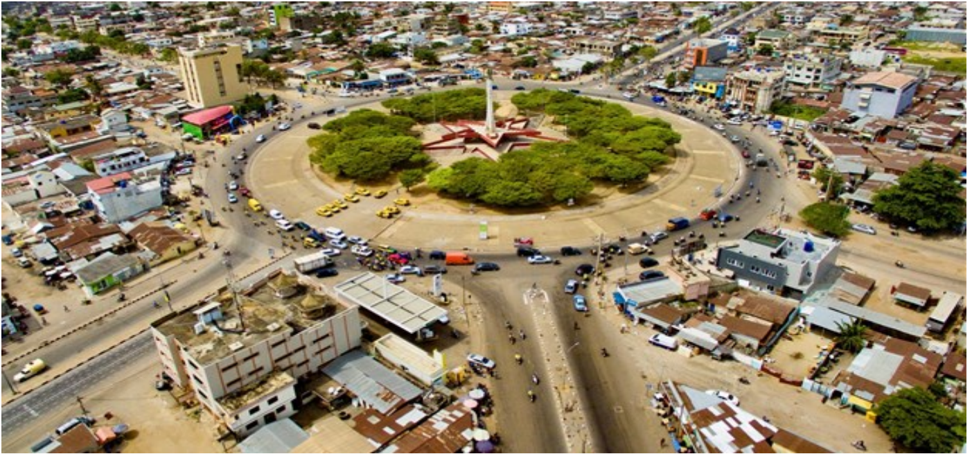
Cộng hoà Benin là quốc gia nằm tại Tây Phi

Thương vụ Đại sứ quán Việt Nam tại Maroc phát đi thông báo tới các doanh nghiệp Việt Nam cần hết sức đề phòng trong giao dịch thương mại với các đối tác tại Benin. Đó là Công ty Weastlinear Holdings Ltd, Global Link SARL Benin, Festival Home Incorporated, Mabic Import Sarl và Benin Import Development Agency.